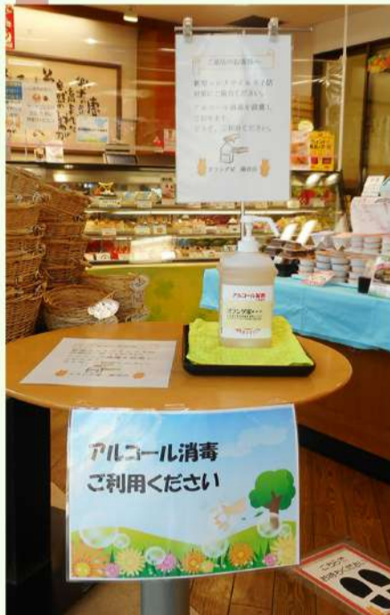
お客様用アルコール消毒液設置 ソーシャルディスタンスの確保

この度の新型コロナウイルス感染拡大防止のため、オランダ家ではお客様ならびに店舗スタッフの安全を最優先に考え、以下の取り組みを行っております。